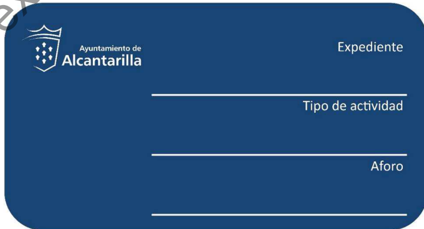
Imagen 2 – Cartel Tipo B.

El tamaño de este cartel es A5 (148,00 mm x 210,00 mm).