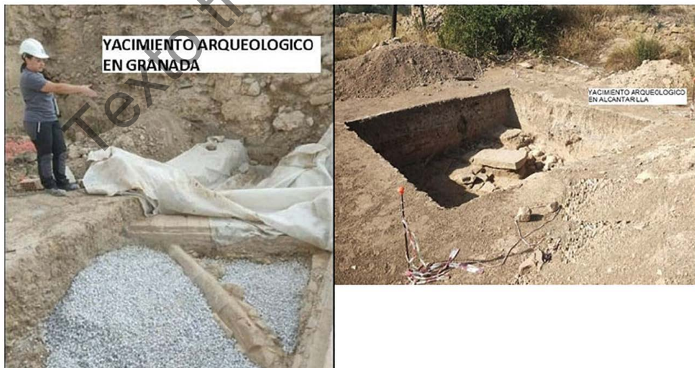
Fotos del estado del Cabezo del Agua

Una vez terminadas la campaña las catas se tienen que proteger con geotextil y chinarro para proteger los restos encontrados e impedir que los estratos se deterioren por ejemplo por lluvias torrenciales.