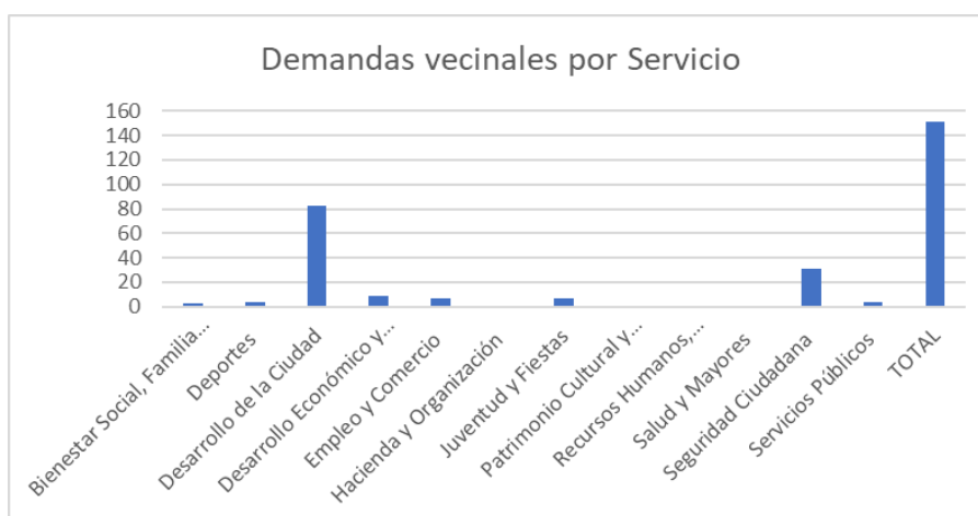
Gráfico. Demandas vecinales por servicio

*El valor no coincide con el número total de demandas reflejado en el apartado anterior por existir demandas que afectan a varios Servicios.