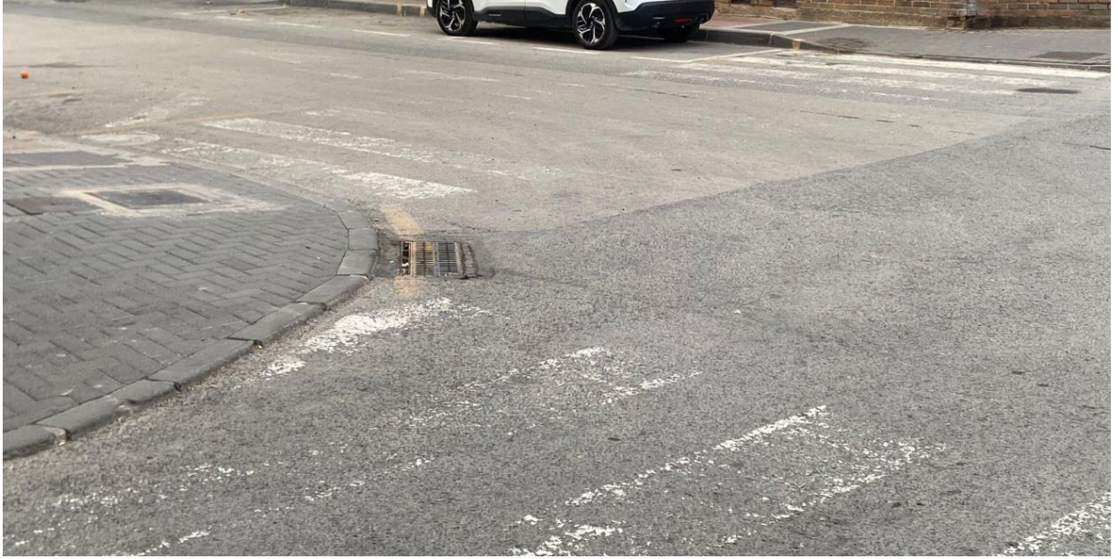
CALLE PINTOR MARIANO BALLESTER, ESQUINA CON CALLE SEVILLA