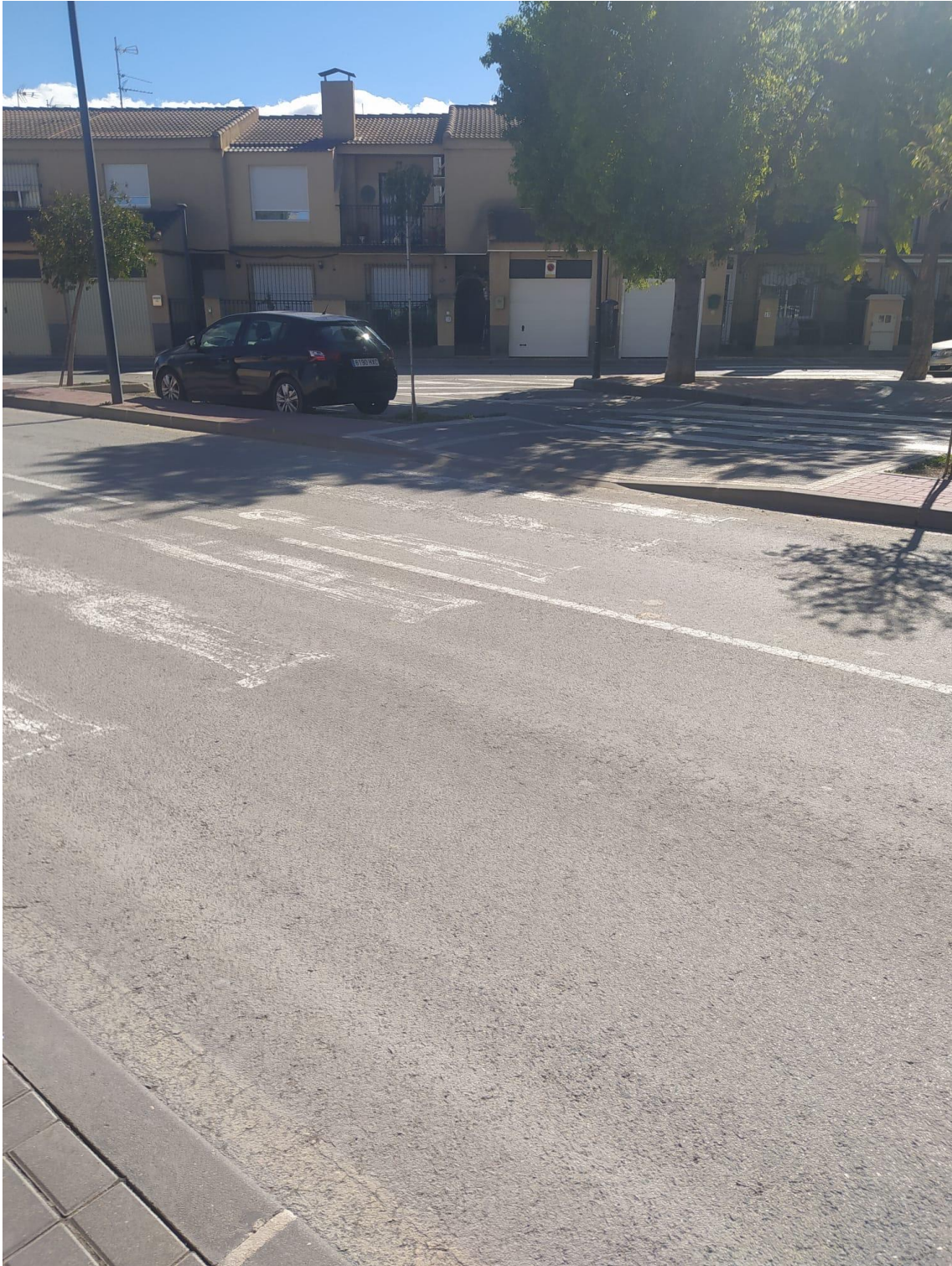
Zona IES ALKANTARA (BARRIO DE LAS TEJERAS)