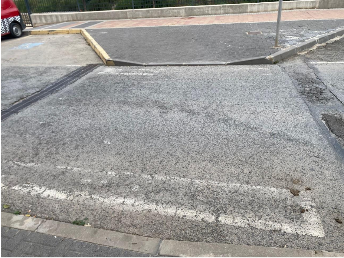
Calle Senador Bartolomé Romero