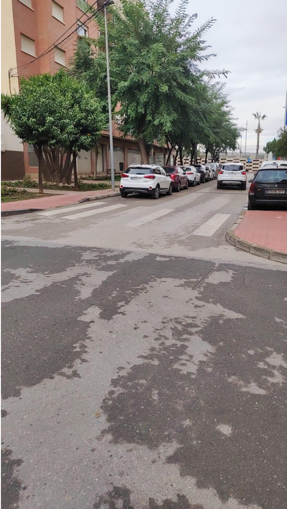
Zona Plaza de Las Flores