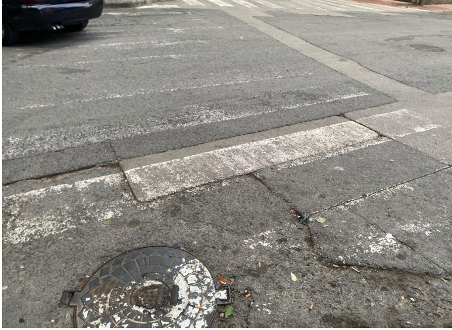
CALLE PINTOR MARIANO BALLESTER, ESQUINA CON CALLE MÉDICO ANTONIO SOLER GARCIA.