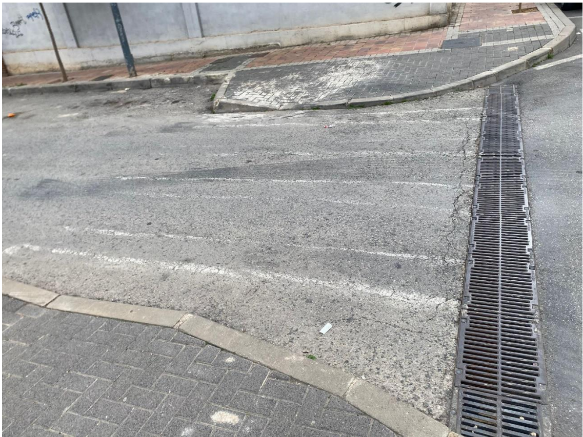
Calle Museo de la Huerta